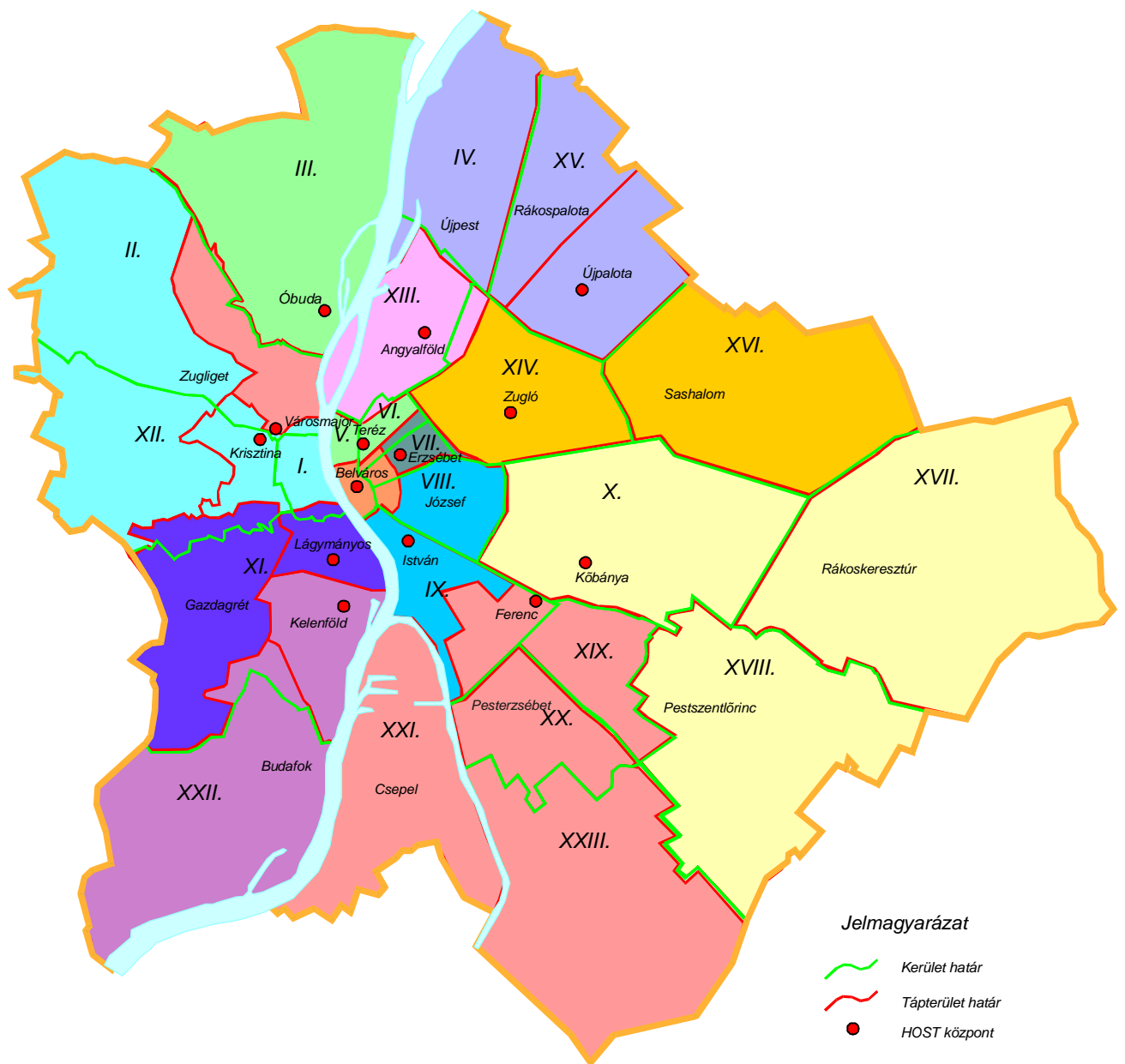
1.2. ábra. A budapesti Helyi Zónák földrajzi elhelyezkedése